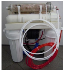
Filter- und Membranbaugruppe