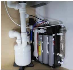
... AQUAPORIN mit 4 Liter Tank