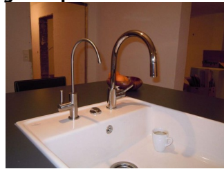
... AQUAPORIN -Auslasshahn (links) neben GROHE CONCETTO (rechts)